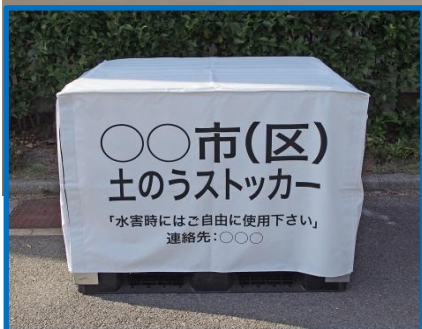
保管時はカバーも出来ます(オプション)