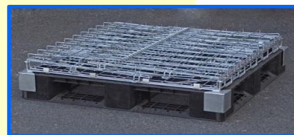
出荷時は折りたんで納入します