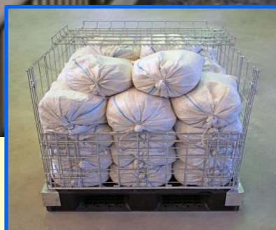
前後扉式なので取出しは どちら側でも出来ます